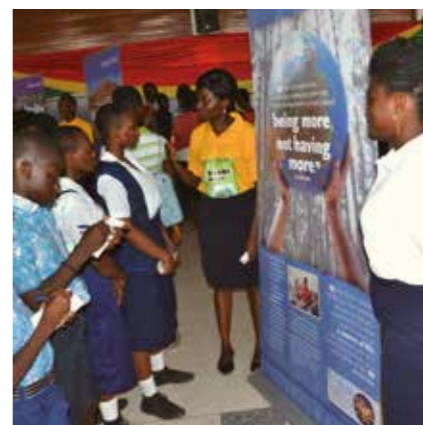
可持续发展教育和气候行动

巴拿马 SGI 为了庆祝并推广和平，在巴拿马的三个城市举办“和平由我开创”（Yo Creo La Paz）的五公里健走活动。（巴拿马，2019 年）