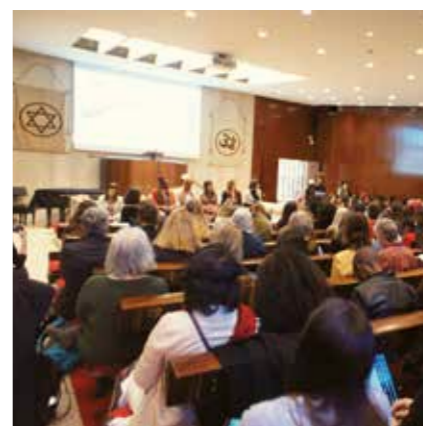
性别平等与妇女自强

为了应对自然灾害，在日本的创价学会会员组成了“志愿者救援小组”，协助受灾居民清理受暴雨和洪水毁坏的房屋等。（日本，2018 年）