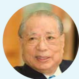
第三任会长 池田大作

户田城圣 （1900–1958）是牧口的弟子也是教育家，同导师牧口携手创立创价学会，并于战争期间一齐被捕入狱。出狱后，户田重整创价学会，其临终前，将日本的组织扩大到拥有约 75 万户会员的规模。户田彻底反对战争，他在 1957 年发表的《禁止原子弹氢弹宣言》被视为创价学会和平运动的起点。