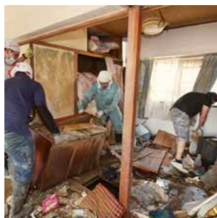
人道主义救济及减少灾害风险

佛教组织欧洲 SGI 和其他合作伙伴在巴黎的联合国教育、科学及文化组织的总部共同举办人权教育展览和研讨会，主题为“生命的变革——人权教育的力量”。（法国，2019 年）