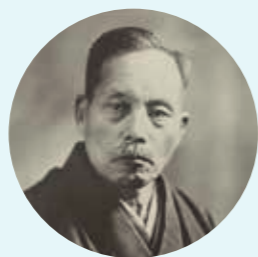
第一任会长 牧口常三郎

创价学会的首三任会长，牧口常三郎、户田城圣以及池田大作为日莲佛法在现代带来了新生命，也为其发展成普及全世界的哲学打下了根基。他们三人在这方面共同的努力更为佛法中的“师弟关系”树立了典范。牧口、户田及池田被本组织视为重要的三任导师。