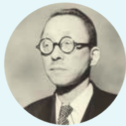
第二任会长 户田城圣

牧口常三郎 （1871–1944）同弟子户田城圣于 1930 年 11 月 18 日创办创价学会*，是第一任会长。身为教育家、哲学家的牧口，因反对日本军国主义政府的政策，在第二次世界大战期间身陷囹圄，最终于狱中逝世。