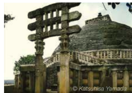
印度的桑吉佛塔一号遗址（或称桑吉大塔）建于公元前三世纪的孔雀王朝阿育王时代

创价学会在全世界拥有 1200 万会员，于基层社会进行活动，致力将《法华经》精神和日莲佛法教义宣扬于现世。