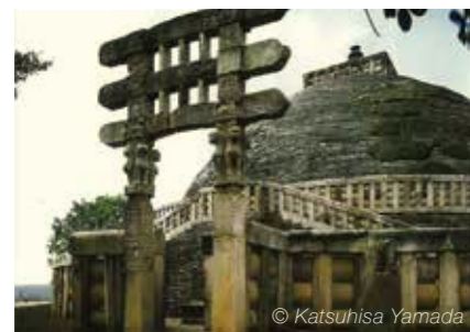
印度的桑吉佛塔一號遺址（或稱桑吉大塔）建於公元前三世紀的孔雀王朝阿育王時代

創價學會在全世界擁有 1200 萬會員，於基層社會進行活動，致力將《法華經》精神和日蓮佛法教義宣揚於現世。