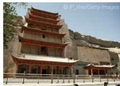
敦煌位於中國西部，是絲綢之路的一個重要據點，擁有數百個具有早期佛教藝術和雕塑特色的石窟