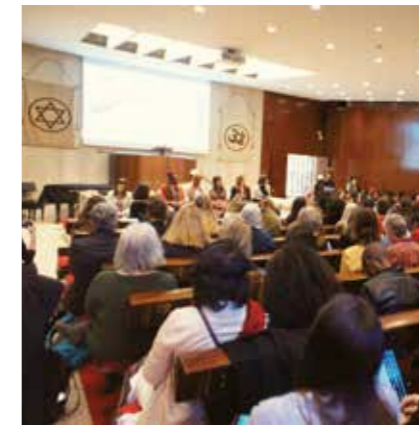
性別平等與婦女自強

為了應對自然災害，在日本的創價學會會員組成了「志願者救援小組」，協助受災居民清理受暴雨和洪水毀壞的房屋等。(日本，2018 年)