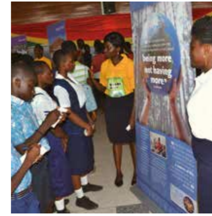
可持續發展教育和氣候行動

巴拿馬 SGI 為了慶祝並推廣和平，在巴拿馬的三個城市舉辦「和平由我開創」(Yo Creo La Paz) 的五公里健走活動。(巴拿馬，2019 年)