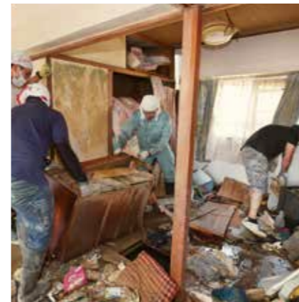
人道主義救濟及減少災害風險

佛教組織歐洲 SGI 和其他合作伙伴在巴黎的聯合國教育、科學及文化組織的總部共同舉辦人權教育展覽和研討會，主題為「生命的變革——人權教育的力量」。(法國，2019 年)